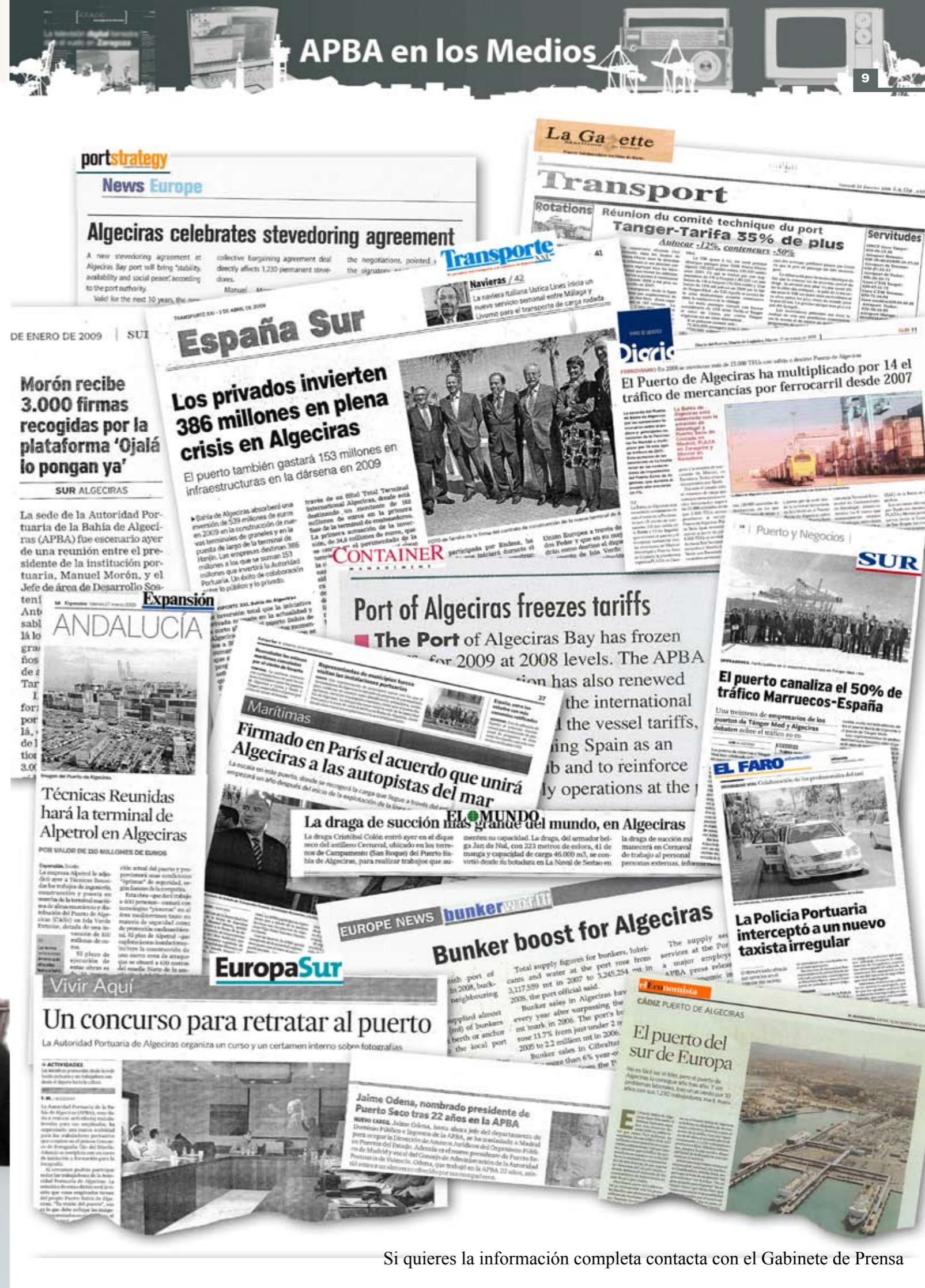
Si quieres la información completa contacta con el Gabinete de Prensa