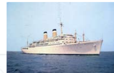
El INDEPENDENCE en la bahía

- INDEPENDENCE : buque gemelo del Constitution. En una escala de enero de 1957 llegó el Rey de Arabia Saudita, Saud Ibn Abdal Aziz Al Saud, que fue cumplimentada a bordo por las autoridades.