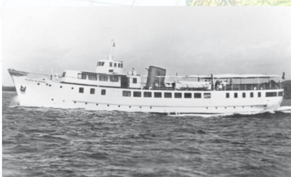
Imagen de la motonave PUNTA EUROPA

Tuve la maravillosa experiencia de conocerlos con motivo de los Time Charter, con sus respectivas navieras, fletando nuestra motonave PUNTA EUROPA para cada escala en nuestro puerto.