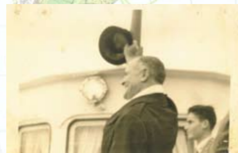
JOHN DAVIS LODGE saludando desde el puente del PUNTA EUROPA, junto a él Carlos de las Rivas

- CONSTITUTION : de 30.090 toneladas, eslora de 208,31 metros y velocidad de 23 millas. La travesía desde el muelle 84 de Nueva York hasta Algeciras, 3204 millas, duraba 5 días y medio. Realizó su primera escala el día 16 de marzo de 1955, desembarcando el nuevo embajador de Estados Unidos en España, JOHN DAVIS LODGE, que cumplimentado a bordo por las autoridades, fue recibido con entusiasmo por casi tres mil algecireños en el muelle de La Galera; para agradecer la bienvenida el embajador subió al puente del PUNTA EUROPA saludando con su sombrero.